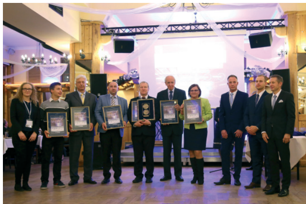
Medale, wyróżnienia i podziękowania wręczone