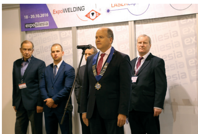
Otwarcie targów ExpoWelding 2016